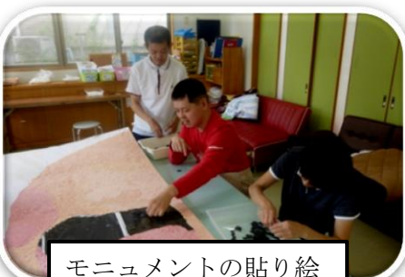
モニュメントの貼り絵