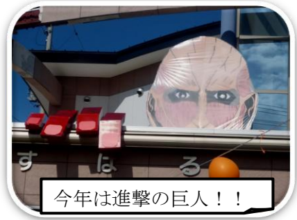
今年は進撃の巨人！！