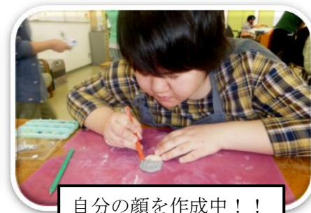
自分の顔を作成中！！